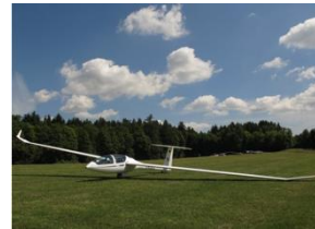
DG 1001 T

Doppelsitzer für Schulung, Kunstflug, Gastflüge und Streckenflug zu zweit.