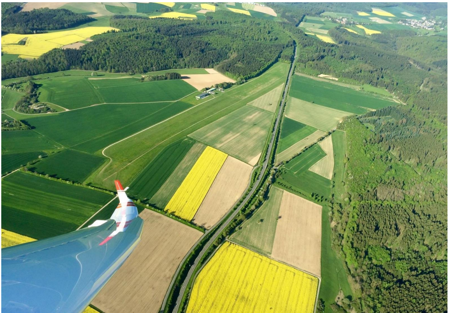
Segelflugplatz Nastätten von oben