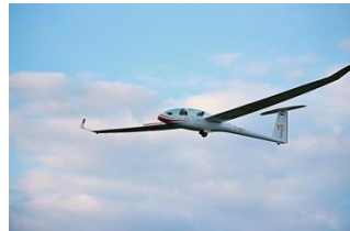
DG 1000 Club

Einsitziges Schulflugzeug. Die Flugschüler machen hiermit die ersten Thermikflüge.